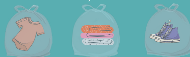
Textiles Linge de maison Chaussures